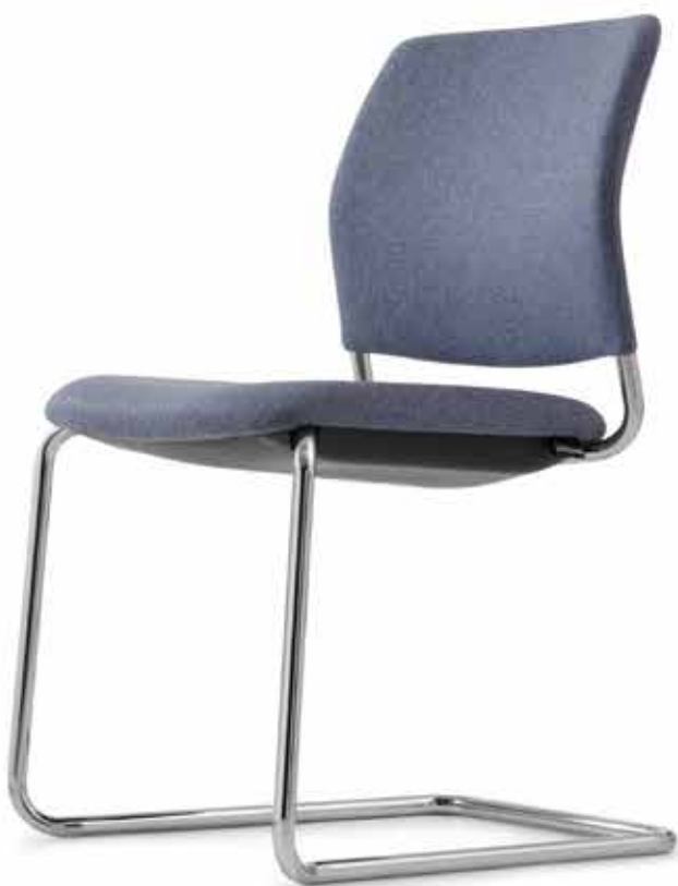
CY 0476 (Impilabile fino a 4 pezzi | apilable hasta 4 unidades)

La silla Cay es siempre cómoda y funcional, y tiene un diseño diáfano que no llama en exceso la atención. Gracias a la apilabilidad cuádruple de serie, las sillas en formato de cuatro patas y cantilever se pueden guardar ahorrando mucho espacio. El resistente armazón cromado es particularmente adecuado para este propósito.