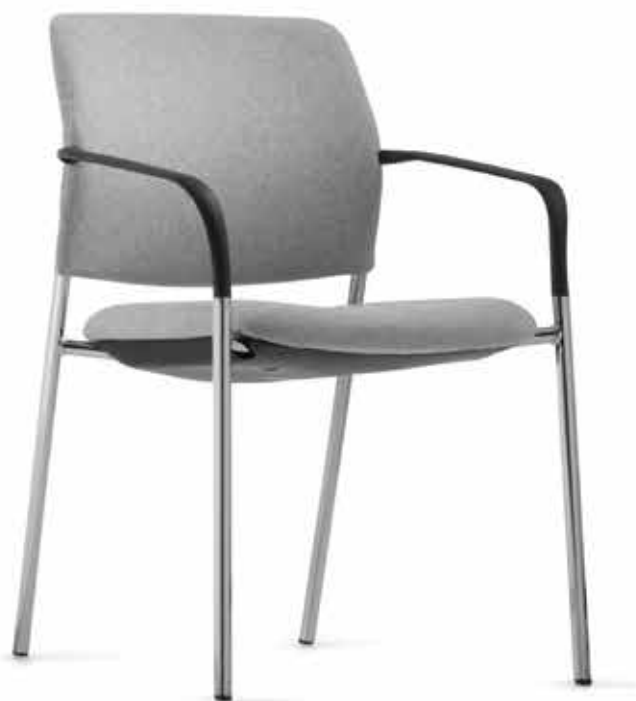
CY 0476 Braccioli in polipropilene non applicabili successivamente | Apoyabrazos de Prolipropileno, no modificable AB05KGS (Impilabile fino a 4 pezzi | apilable hasta 4 unidades)