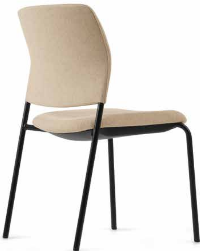
CY 0470 (Impilabile fino a 4 pezzi | apilable hasta 4 unidades)

El color negro estructura las estancias luminosas, les aporta orden y profundidad, y crea contrastes interesantes. La silla Cay en formato de cuatro patas y cantilever, con el armazón negro y la tapicería completa en tonos suaves y armoniosos, transmite un aspecto moderno y con personalidad al mismo tiempo.