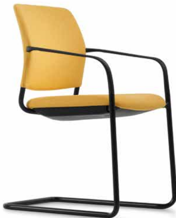
CY 0476 Braccioni in polipropilene non applicabili successivamente | Apoyabrazos de Prolipropileno, no modificable AB05KGS (Impilabile fino a 4 pezzi | apilable hasta 4 unidades)